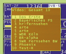
DVB-S transponder z MPEG2